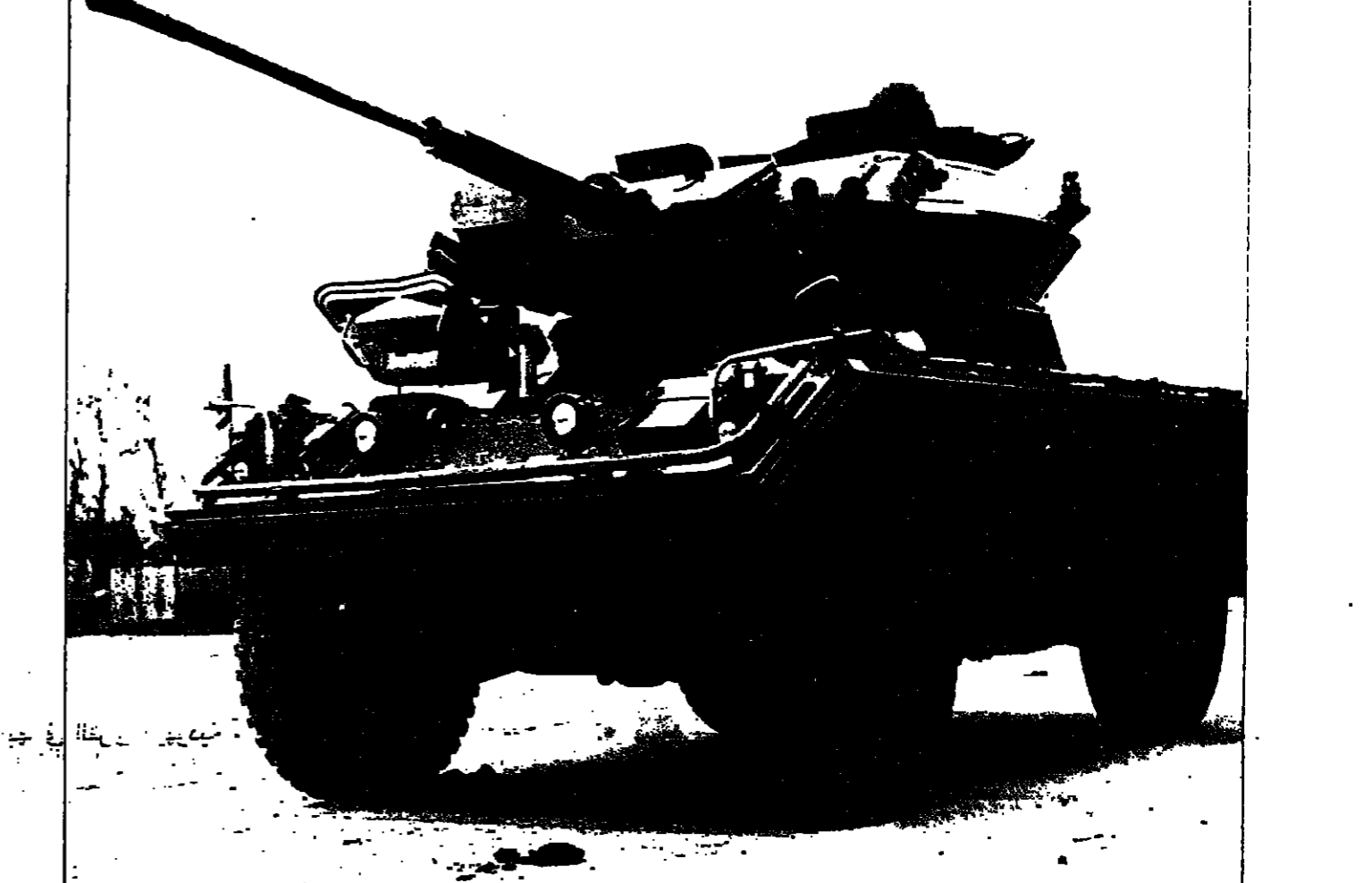
دبابة (فوكس) رشيقه حققت نجاحا تجاريا

وعن ان التقوية البريطانية الرسمية نفس باخار دقيق للزيان الرابعين سي شراء اعدة عسكريه بريطانية ، فان أمن وزارة الدفاع اللورد سترانكون لا يخفي سرا عندما يقول ان مهمه هو استعادة بريطانيا التي ناري الدول الثامنة للمدافع . واطلا من هذا الهدف حت اللورد سترانكون مصانع الاسلحة الانكليزية الحاصه والمعامة على انتاج سلاح يجب